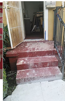
Figure 4: ¡Estoy celoso! Mis pasos se muestran aquí, con "the Saint's" mi salpicadura? Además, hay en la siguiente foto, después de que se vertió concreto para una nueva pasarela.