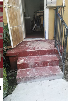
Figure 4: I'm jealous! My steps pictured here, with "the Saint's" in the next pic, after concrete was poured for a new walkway.