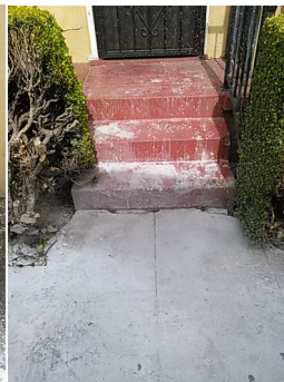
Figure 5: ¿Por qué recibió algo de se muestran aquí, con "the Saint's" mi salpicadura? Además, hay muchos otros lugares que tampoco obtuvieron nada.

Beruf: Luftmensch (Una nueva sección en la que hablo del progreso, si lo hay... en mis proyectos):