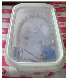
Figure 3: The DIY red LED night light mentioned in HSH #27 ¡Que no va! OK?