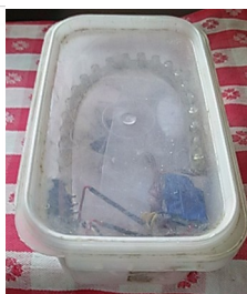
Figure 3: La luz nocturna LED roja de bricolaje mencionada en HSH #27 ¿Que no va! OK?

Figure 2: Ignore la pequeña travesura autoindulgente (Addams deliberadamente mal escrita con [sic] agregado por si acaso) que un amigo me señaló como un posible error. Point d'erreur. Nenni!