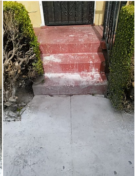
Figure 5: Why did he get any of my splatter? Moreover, there's tons of other places that didn't get any either.